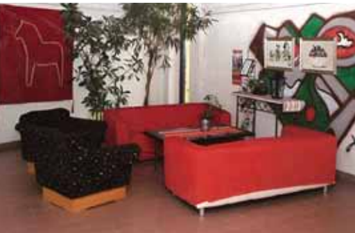
Elevhemmet Hammaren, Slottegymnasiet, Ljusdal