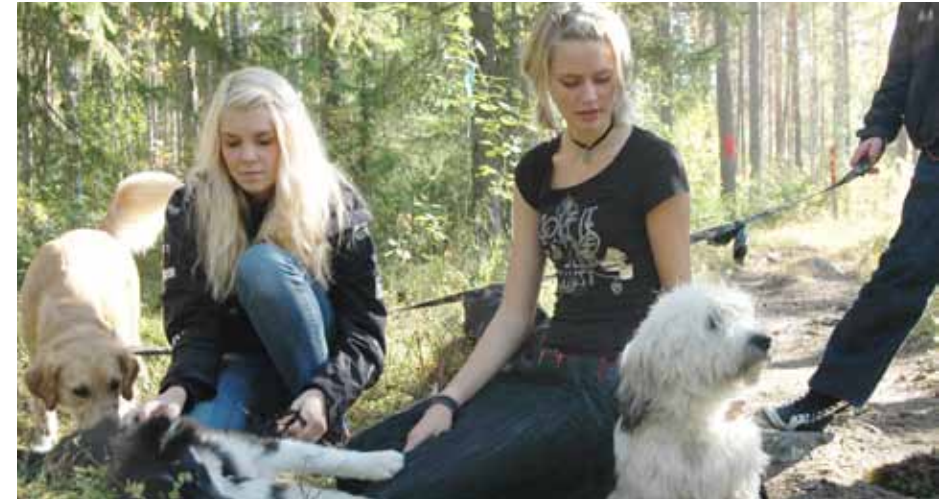
Efter yrkesutgång Hund kan du fortsätta din utbildning mot hundtrimning, kennelverksamhet, hunddagis, hunddressör, hundpensionat, fysioterapeut eller hundpsykolog.

Under år 2 och 3 kan du även välja häst som individuellt val.