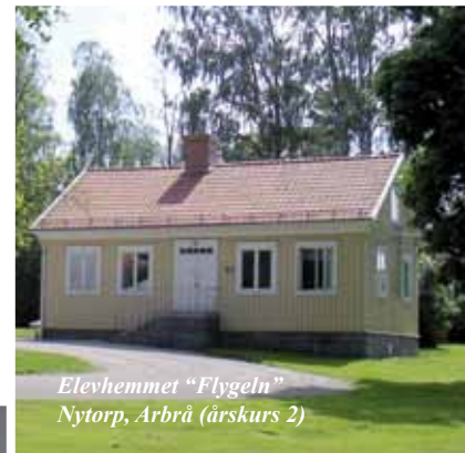
Elevhemmet "Flygeln" Nytorp, Arbrå (årskurs 2)