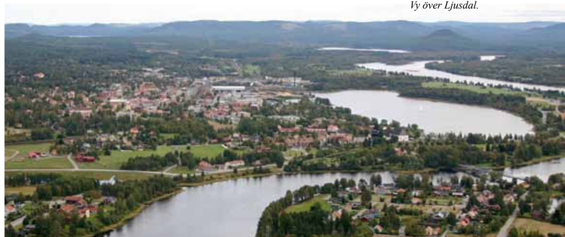
Vy över Ljusdal.

Att maten är bra vet vi genom allt beröm vi får. Den mat som serveras hos oss lagas också på skolan, vilket är viktigt för att kunna hålla den standard vi vill ha. De flesta dagar jobbar hotell- och restaurangeleverna i storköket med tillagning av maten. Det ingår som ett led i deras utbildning.