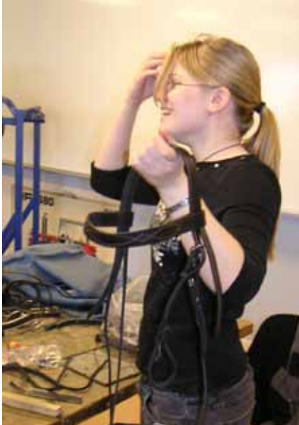
Många elever väljer lädersömnad som Estetisk versamhet.

På Nytorp har vi ett elevstall där elever med egen häst har möjlighet att hyra in sin häst under terminerna. Priset inklusive foder och strö ligger mellan 1500-2000 kr i månaden. Inom ett par hundra meter ligger skolans ridhus och precis utanför börjar skogen med mil av ridstigar.