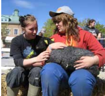
Tre framtida landskapsvårdare.

Under årskurs 1 så läser du kurserna engelska 5, Svenska 1, Matematik 1 och Idrott och hälsa 1 men också Biologi 1, Entreprenörskap och Naturbruk. I kursen Fordon och redskap så jobbar du med målet inställt på att klara av körkort för traktor, vilket är en värdefull merit när man söker jobb inom lantbruksbranschen.