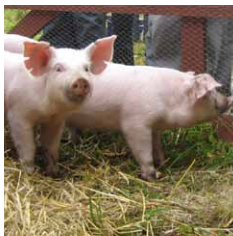
Det är inte bara eleverna som stortrivs på Nytorp.

Under årskurs 2 fördjupar du dig inom de områden som du valt och som du är intresserad av. Du kommer också inom ramen för Ung Företagsamhet (UF) starta och genomföra ett UF-företag för att lära dig hur man driver ett mindre företag. I slutet av årskurs 2 går man ut på Arbetsplatsförlagat Lärande (APL) under 15 veckor. Här förbereder man sig inför ett yrkesliv efter gymnasiet samtidigt som man får värdefulla erfarenheter inom de ämnen som man påbörjat att läsa på skolan.