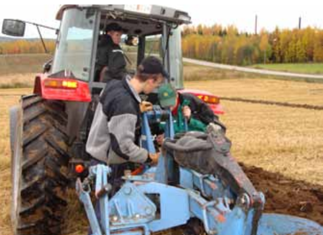
Att bruka jorden långsiktigt hållbart är självklart för en naturbruksutbildning.

Det är framför allt under de två senare åren som man jobbar mot sin programfördjupning som avslutas med en yrkesexamen. För de som valt lantbruk så finns det två yrkesutgångar att välja mellan, djurskötare och maskinförare inom lantbruket. Det valet gör man inför årskurs 3.