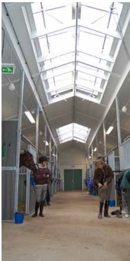
I stallet är det ljus och gott om plats.

Under årskurs 2 fördjupar du dig inom de områden som du valt och som du är intresserad av. Du kommer också inom ra-