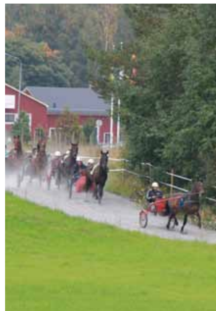
Elever i full fart på skolans egen rundbana.