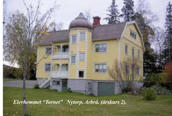
Elevhemmet "Tornet" Nytorp, Arbrå. (årskurs 2).

Storleken på bidraget varierar från kommun till kommun men det vanligaste är ca 1400:- per månad. Studievägledaren på din skola kan informera vad som gäller speciellt för din kommun.