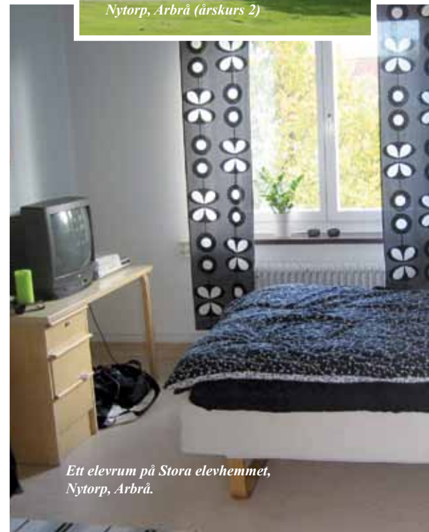
Ett elevrum på Stora elevhemmet, Nytorp, Arbrå.

Att bo på elevhem tillsammans med alla klasskompisar är något som många drömmer om, men det kräver att man både visar hänsyn och kan ta ansvar.